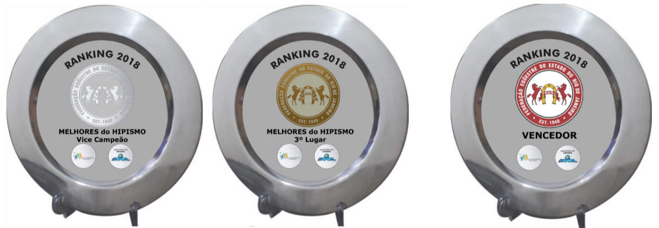
Trofeus de CAMPEONATO BANDEJAS 33 cm( Prata e Bronze)